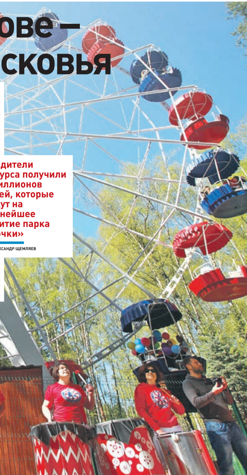
ФОТО: ПАРК «ЕЛОЧКИ»